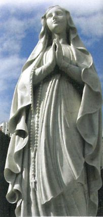
聖母 — 護佑、代禱