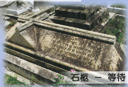
石柩 — 等待