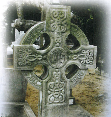
十字架 — 救贖

基於這種生死觀，墳場成爲已逝世天主教徒期待永生、與主相遇的地方。在墳場內的塑像很多時都反映了有關概念，以下是其中一些含有這些象徵意義的雕像：