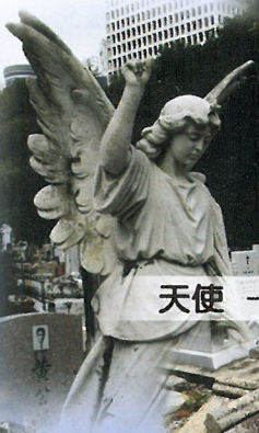
天使 — 天國來臨