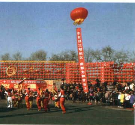
的河南原阳盘鼓表演

简目。因年代久远，北宋原本已佚。清代修《四库全书》，据天一阁藏本及《永乐大典》引文等，辑为12卷，收入史部目录类之首。