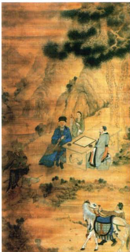
图1 郑成功像（清）黄梓绘 （中国国家博物馆藏）

十五年七月，率兵十余万，大小战船数百艘，联合原鲁王部将张煌言北伐。因风受阻。翌年五月，再率兵由舟山出发，连克瓜洲、镇江，进逼南京。张煌言和杨朝栋率领的水师前锋，还上溯芜湖。在南京城外因轻敌受清军突袭大败，骁将甘辉等死难。乃退出长江，回到厦门。十七年，