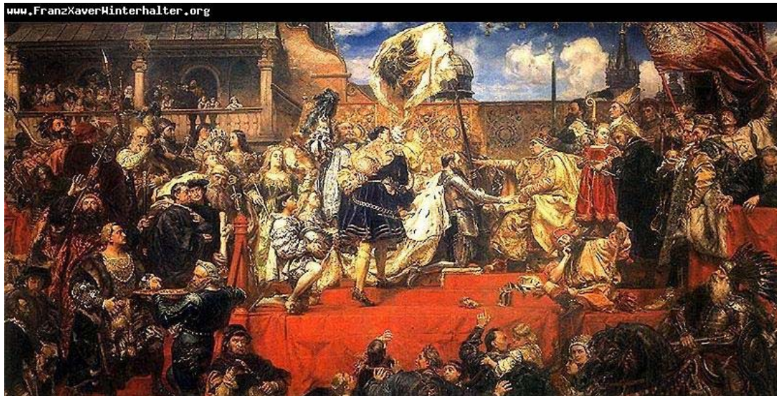
《普魯士臣服波蘭王國》，波蘭畫家揚·馬泰伊科(Jan Matejko)的畫作，圖中穿鎧甲跪地者為條頓騎士團總團長阿爾布雷希特·馮·霍亨索倫-安斯巴赫(Albrecht von Brandenburg-Ansbach)，他將騎士團國家改造為世襲公國，並自波蘭國王手中領受殘存的騎士團領土，成為普魯士公國的首任公爵。

總團長帕勞恩雖然無法挽救已經衰弱的騎士團國家，卻延長了這個虛弱國家的年祚。在1411年的《第一次托爾恩和約》中，騎士團國家僅以巨額賠款，便能了事。然而，伴隨巨額賠款而來的社會與政治問題，又使得騎士團國家與境內的城市產生對立。1440年，這些城市組成了普魯士聯盟，並在13年後，與騎士團展開了13年的戰爭(1453-1466)。迫於普魯士聯盟的後台——波蘭王國的壓力，騎士團國家與波蘭簽署了《第二次托爾恩和約》，這次騎士團國家不但損失大半國土(西普魯士，因歸波蘭王室直轄，故也稱為王家普魯士)，連剩餘的東普魯士都被當作波蘭的封邑，從而註定了騎士團國家的衰亡。然而，這個苟延殘喘的騎士團國家的滅亡，還要到1525年才因宗教改革，為總團長阿爾布雷希特·馮·霍亨索倫-安斯巴赫(Albrecht von Brandenburg-Ansbach)給世俗化，成為波蘭王國治下的普魯士公國。至於，條頓騎士團的立沃尼亞分團，也是在這波宗教改革的浪潮下(1561年)，世俗化成為臣屬於立陶宛大公國的庫爾蘭公國。