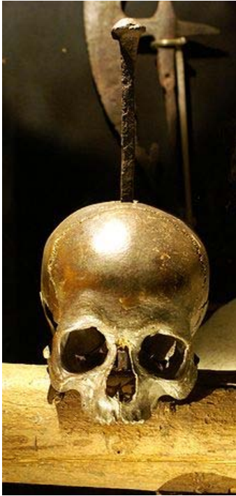
波羅的海海盜集團——運補兄弟會

丹麥等國之邀，前往哥德蘭島(Gottland)，解決波羅的海海盜集團——運補兄弟會(Vitalienbrüder)，他們本為波羅的海的零星海盜團伙，然在1389年的丹瑞戰爭中，以海運方式援助被困已久的斯德哥爾摩，於是得到瑞典王室給予海盜行為的特許證書，從此逐漸壯大。雖然騎士團未能徹底根絕運補兄弟會的海盜活動，但他們仍舊將運補兄弟會逐出哥德蘭島與波羅的海，騎士團並趁此機會佔領了哥德蘭島(直到1408年)。在海上擴張的同時，騎士團也不忘在陸上的擴張，然而，也因此與波蘭王國與立陶宛大公國產生衝突。這一衝突，也種下了騎士團國家衰弱的種子。