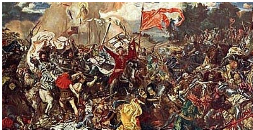
Battle of Tannenberg. 1410.

1410年的坦能堡戰役 (Battle of Tannenberg)，正是騎士團國家毀滅的開始。1386年，騎士團國家的宿敵波蘭(Poland)王國與立陶宛(Lithuania)大公國達成了聯盟與君合的協議。於1407年接任條頓騎士團總團長的烏爾利希·馮·容金根 (Ulrich von Jungingen)了解到這個聯合對騎士團國家的威脅，於是決心先發制人。在1410年他主動出擊波蘭-立陶宛聯軍 (坦能堡戰役 Tannenberg)，然而騎士團在這次的戰爭中慘敗，自總團長以下的所有騎士幾乎全部陣亡，騎士團領地紛紛叛離。騎士團勉強在來援的亨利希·馮·帕勞恩(Heinrich von Plauen)領導下，擊退了波-立聯軍對瑪麗亞堡的攻擊。