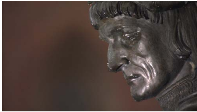
騎士團總團長赫爾曼

在受到教會與世俗力量予以肯定的同時，條頓騎士團對普魯士的征討也表現出色，不但統治了普魯士大半的領土，還從馬佐維亞(Masovia)公爵手上拿到了庫爾姆蘭(Kulmerland)的統治權。此後，騎士團國家一躍成為波羅的海南岸的一大強權。另一方面，由里加(Riga)主教組織起來的聖劍騎士團，雖然在立沃尼亞地區一度強盛，然而此時卻因波羅的海人的強烈抵抗而衰弱下來，於是在1237年與條頓騎士團合併，成為條頓騎士團的利沃尼亞分團。然而，合併並沒有為立沃尼亞騎士團帶來生機，1256年在庫爾姆蘭、1259年在斯庫歐達斯與1260年在杜爾拜湖畔，三次戰爭立沃尼亞騎士團均以敗績收場。至1242年，騎士團更於楚德湖為諾夫哥羅德(Novgorod)大公所痛擊，此役確定了騎士團國家東進的極限，也使得騎士團國家將重心重新移回到普魯士的征討上。1242年普魯士人發起持續了11年的叛亂。最後在1283年徹底將普魯士剩餘的部份征服下來，從此終結了波羅的海族的普魯士時代。